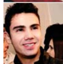
Design Fayne Scalioni