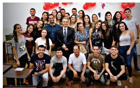
9ºB escolhe professores homenageados