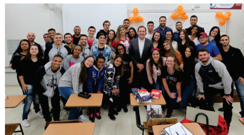
Acadêmicos agradecem professor substituto com homenagem