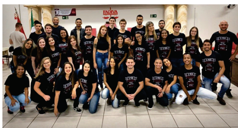
5ºA festeja a metade do curso de Direito