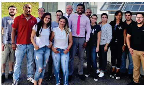
Acadêmicos visitam a unidade prisional de Varginha