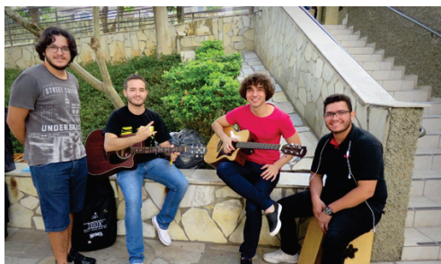
Alunos do projeto Motiv'Art se apresentam durante o intervalo para os acadêmicos