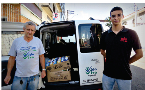
Representante do Viva Vida recebe caixas de leite arrecadadas durante a palestra "Mediação como Prática de Transformar e Resolver Conflitos"