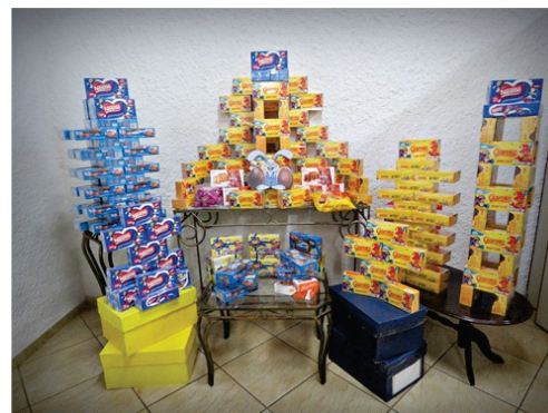
Páscoa solidária arrecada mais de 170 caixas de bombons