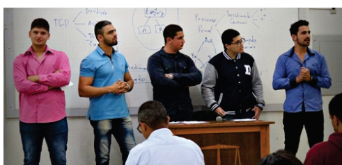
Acadêmicos do 3º período apresentam seminário de Direito Constitucional