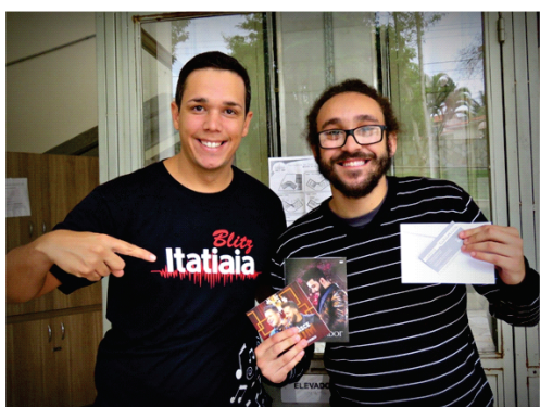
FADIVA e Rádio Itatiaia promovem gincana no Dia da Voz