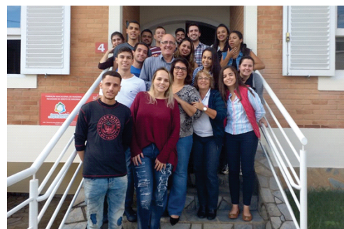
Tradicional confraternização entre professores, colaboradores e acadêmicos encerra o período de atividades do SERAJ