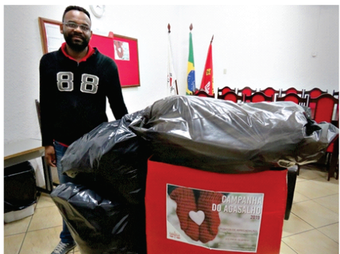
Campanha do Agasalho da FADIVA arrecada e faz a doação de mais de 500 peças