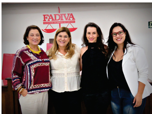
Núcleo de Extensão promove palestra sobre mediação de conflitos aos acadêmicos