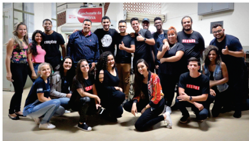
Acadêmicos do Pokets FADIVA se apresentam no MUC