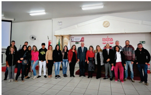
Acadêmicos participam de palestra sobre Advocacia Extrajudicial